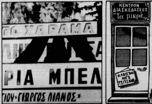
Πένθος και στο «Χάρισμα».

● Απεκοιμήθη στον Βασίλη Τσιτσάνη είναι η ερασιμα εκπομπή της ΕΡΤ-1 «Αφαιρήματα», που θα προβληθεί στις 9.30 το βράδυ. Θα δοθεί σταθμισμένα από συνμηλίες και εκπομπές από το αρχείο της ΕΡΤ-1.