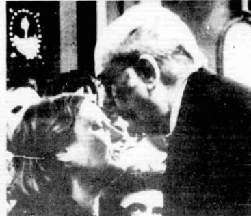
Μέσα από το κορμί του λαού μας, μια ηλικιωμένη γυναίκα δίνει το τελευταίο φιλί στο Βασίλη Τσιτσάνη. ΔΕΞΙΑ: Ο πρωθυπουργός Ανδρέας Παπανδρέου ασπάζεται τη χήρα του συνθέτη που έφυγε.