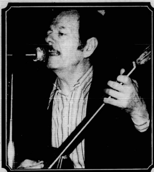
Ο Βασίλης Τσιτσάνης σε μια από τις τελευταίες του εμφανίσεις.

Χτες το μεσημέρι ο πρόεδρος της Δημοκρατίας κ. Κωνσταντίνος Καραμανλής διαβίβασε στην οικογένειά του Τσιτσάνη τη συλλυπητήριά του για το θάνατο του λαοφιλή συνθέτη.