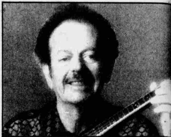
Γράφει ό ΑΡΙΣΤΥΡΗΣ ΖΗΛΟΣ

'Ο Βασίλης Τσιτσάνης έδωσε κάποτε μάχες, γιά νά αποδείξει ότι υπάρχει. 'Ότι υπάρχει σάν άτομο, πρίν και πάνω απ' όλα —γιατί, τό ότι υπήρχε σάν μουσικός, ήταν κάτι που έ- λοι τό ξέρανε αλλά, γιά τούς «άλλους», δέν είχε