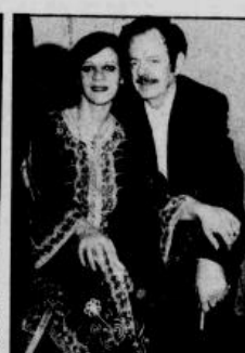
Στηριξάμε τις γυναικες και τραγουδουσα καλλις εμμερσις του Τονωδου: Αλφειου Νικολιδου, Πιου Ξανθοκλειου, Αλφειου και Ελ. Γεωργ. Τους θηροφους και το θανατο του μεγαλου δακτυλου.

Ἡ Χερσίδα Διατριβὴ με τὸν ἀξιόλογο λαϊκὸ βάρδο